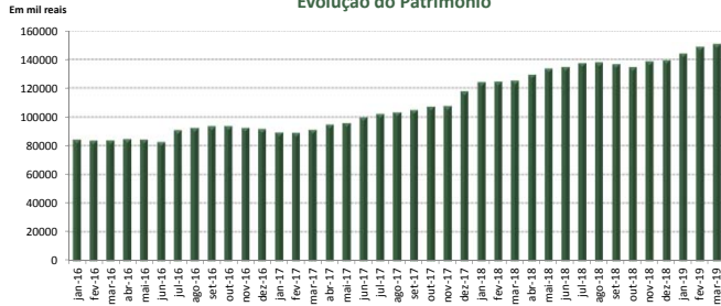
Evolução do Patrimônio